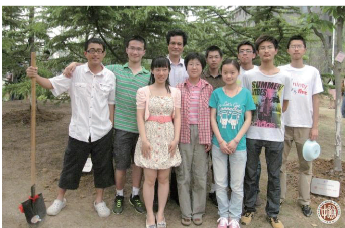
本版责编：成平 本版摄影：繁简等

本报讯 5月12日上午，由南京大学举办的“互融、合作、共进——两岸中学校长论坛”在南京国际会议大酒店隆重举行。该论坛是南京大学110周年校庆系列活动之一，我校校长姚天勇受邀与内地、台湾和澳门的其他137所著名中学的校长出席。