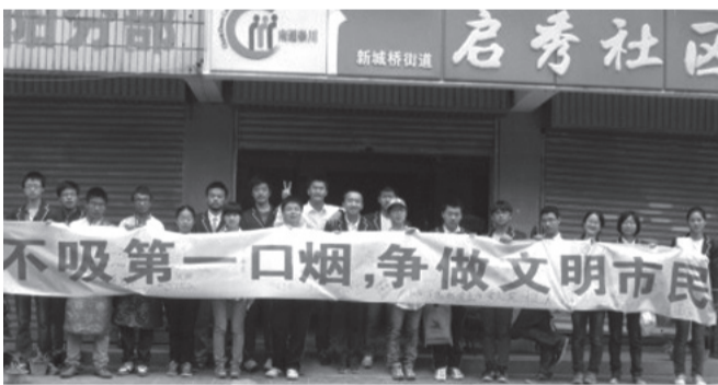
5月12日,我校高二年级的青年团员和启秀社区一起组织开展了“不吸第一口烟 争做文明市民”的签名活动。