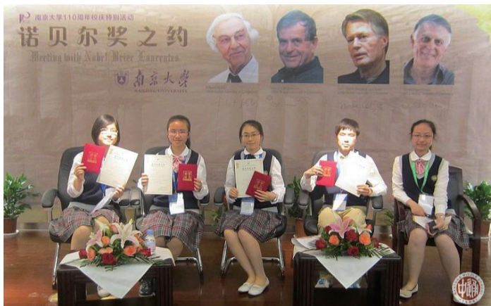
参加“诺贝尔奖之约”的五名通中学子

本报讯 5月19日晚，南京大学举办110周年校庆特别活动“诺贝尔奖之约”。应邀出席活动的4位诺贝尔奖获得者是：1988年诺贝尔化学奖得主罗伯特·哈博、2004年诺贝尔化学奖得主阿龙·切哈诺沃、2008年诺贝尔文学奖得主勒·克莱齐奥和2011年