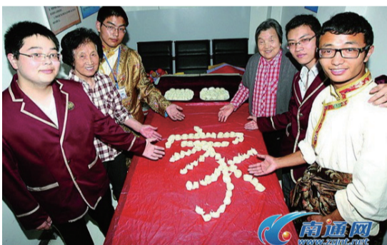
把包的饺子摆成‘家’，喜迎母亲节。

江苏网、南通网、江南时报、南通日报、江海晚报、南通电视台等多家新闻媒体对南通市民的募捐活动都有详细报道。（综合）