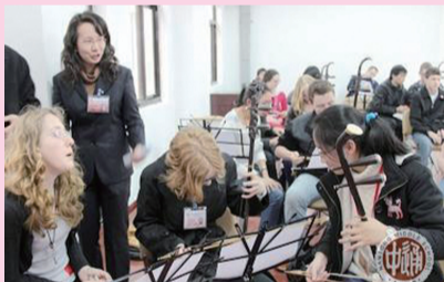
中国民乐课 在音乐教室上