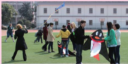
与通中学生一起放风筝