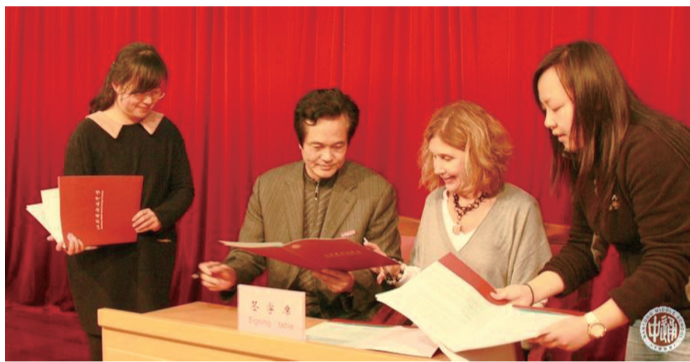
我校与兰斯克鲁斯学区签署友好学校协议