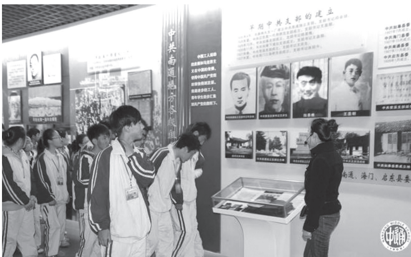
参观革命烈士纪念馆