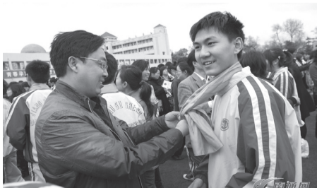
为儿子系上成人纪念丝巾